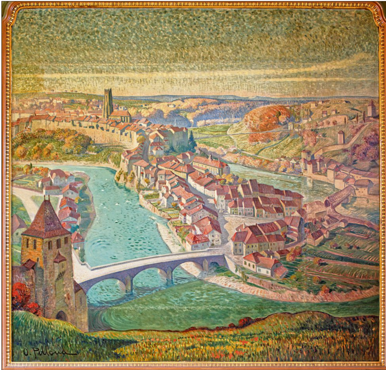
Oswald Pilloud (autoportrait réalisé vers 1900) a peint, pour le buffet de la gare de Lausanne, cette vue de la ville de Fribourg. A droite, son marché.