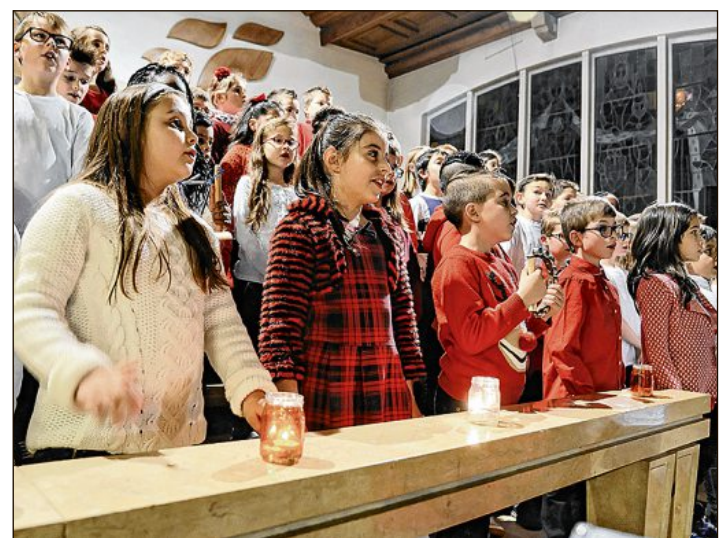
A Courtepin, l'église s'est emplie du chant de plus de 200 enfants.

celles du bâtiment – qu'ils ont décorées – pour y entonner des chants. Avant-goût de Noël aussi à Courtepin mercredi soir, lors du concert organisé à l'église du village par l'établissement scolaire. L'église a été animée par une foule de près de 700 personnes, dont 200 enfants, qui ont chanté pour la bonne cause. Selon les vœux des enseignants, qui organisaient pour la première fois la manifestation, les 1500 francs de dons récoltés iront à la fondation Corelina, que soutient Lauriane Sallin, notre Miss Suisse, présente pour l'occasion. NR